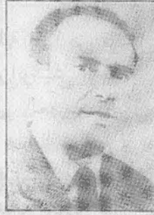
المهدي ابن بركة الضحية